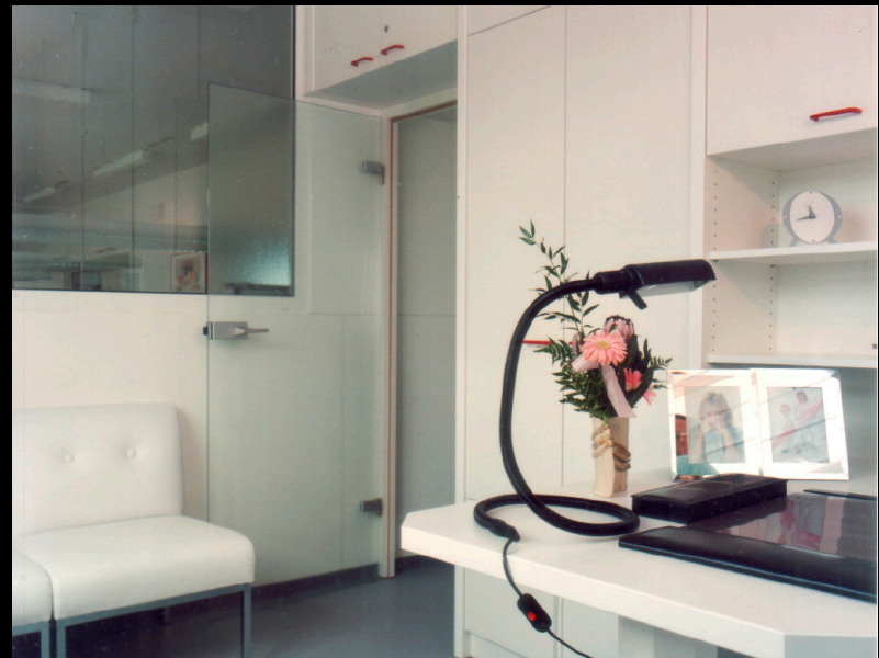
► 4 Patientenraum

Sieben Jahre später, 1994/95, war eine Erweiterung notwendig, um 40 Arbeitsplätze zu schaffen. Heute, 40 Jahre später, sind wir ein Team von über 40 Mitarbeitern – mit einer sehr guten Auslastung. (► 2 bis ► 6)