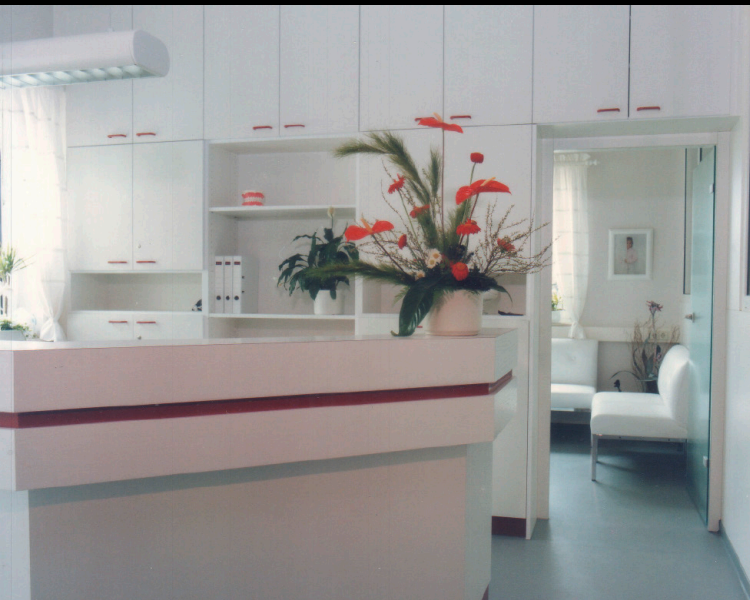
► 3 Empfang

Trotz eines allgemeinen Abwärtstrends in der Branche ab 1984 erlebten wir unser eigenes Wachstum – vor allem dank junger Zahnärzte, die die Umsatzrekorde der 70er Jahre nicht kannten und offen für Neues waren. Bereits nach zwei Jahren wuchs unser Team auf 18 Personen, und ich entschied mich, ein größeres Labor in meiner Heimatstadt Speyer zu bauen, das Platz für 25 Mitarbeiter bot.