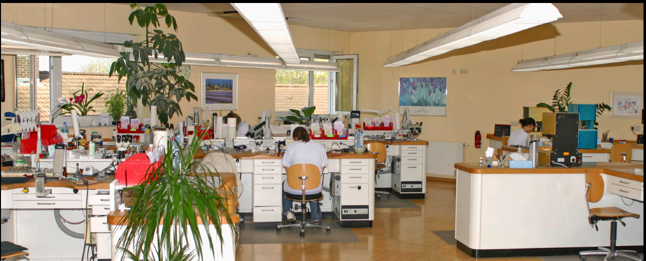
► 6 Keramikabteilung

Labors fragte er mich: „ Wissen Sie überhaupt, wo Sie sich als Labor qualitativ einordnen? “ Ich antwortete: „ Keine Ahnung. “ Seine Antwort: „Sie gehören zu den obersten 5 Prozent der Dentalbranche.“