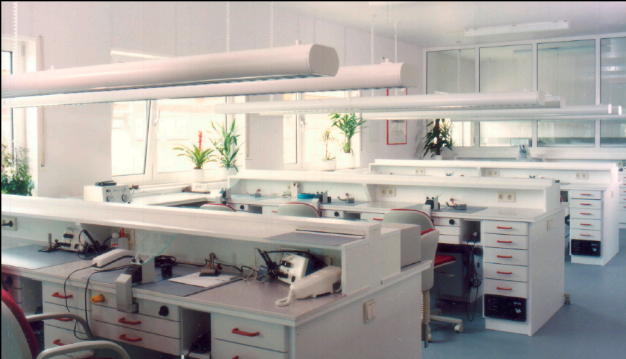
► 5 Labor