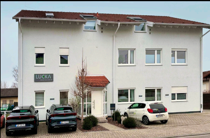
► 2 Labor in Speyer

bestimmt. Dieses Prinzip habe ich meinen Mitarbeitern von Anfang an vermittelt: „Arbeitet so, als würdet ihr die Arbeit für euch selbst machen.“ Dies ist, wie ich es nenne, das kleine Geheimnis unseres Erfolgs.